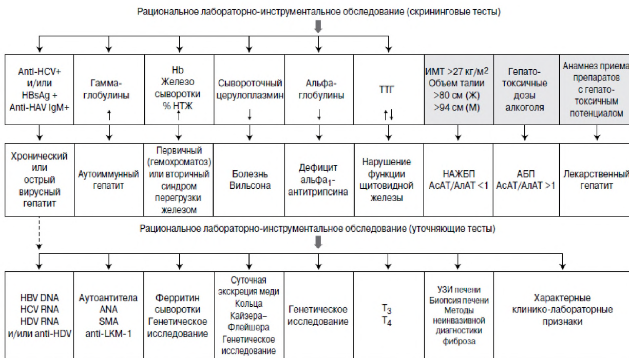
Рисунок 2. Дифференциальный диагноз алкогольной болезни печени

Особую сложность в ведении пациентов с АБП представляет дифференциальный диагноз измененного сознания. Спутанность сознания может возникать не только по причине гипераммониемии (печеночная энцефалопатия), но и в результате нейротоксического действия алкоголя, при развитии энцефалопатии Вернике, корсаковском психозе, синдроме отмены. На стадии ЦП причинами измененного сознания могут быть внепеченочные состояния, которые вызывают или усугубляют симптомы ПЭ — так называемые провоцирующие факторы [90]. К ним относятся хорошо известные факторы: инфекции (пневмония, мочевиная инфекция, спонтанный бактериальный перитонит, сепсис, острый гастроэнтерит и другие), желудочнокишечные кровотечения, запор, избыточное расщепление глутамина глутаминазами тонкой кишки, дегидратация, гипонатриемия, гипокалиемия, неконтролируемое использование диуретиков, прием бензодиазепинов, избыточное употребление белка и факторы, роль которых в развитии ПЭ активно обсуждается в последние годы: потеря скелетной мышечной массы (саркопения) и наложение трансъюгулярного внутрипеченочного портосистемного шунта. Мероприятия, направленные на устранение/коррекцию этих факторов, в комбинации с гипоаммониемической терапией сопровождаются клиническим улучшением ПЭ.