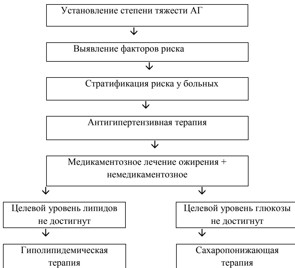
Рисунок 2. Тактика лечения больных с МС и АГ